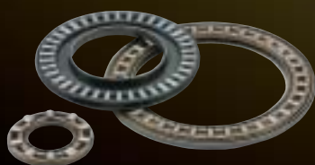
Thrust Needle Roller Bearings for Compressor コンプレッサ用 スラストニードルローラベアリング