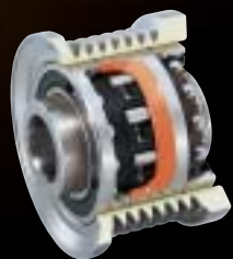
Compact Clutch Integrated Pulley 小型クラッチ内蔵プーリ