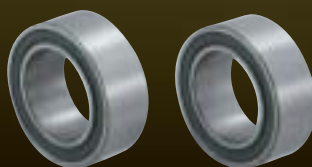
Ball Bearings for Electromagnetic Clutch カーエアコン電磁クラッチ用複列軸受