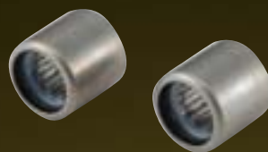
Drawn-cup Needle Roller Bearings for Throttle Body スロットルバルブ用シェル形 ニードルローラベアリング