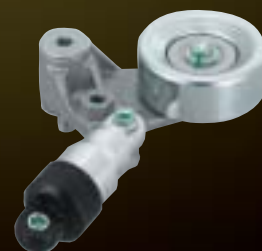
Short-type Auto Tensioner for Accessory Belt Drive 補機ベルト用ショート型 オートテンショナ