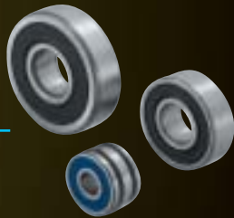
High-Temperature and Long-life Bearings for Alternator オルタネータ用高温長寿命軸受