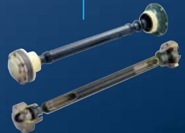
Constant Velocity Joints for Propeller Shaft プロペラシャフト用等速ジョイント