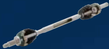
Constant Velocity Joints for Halfshaft ハーフシャフト用等速ジョイント (フロント)