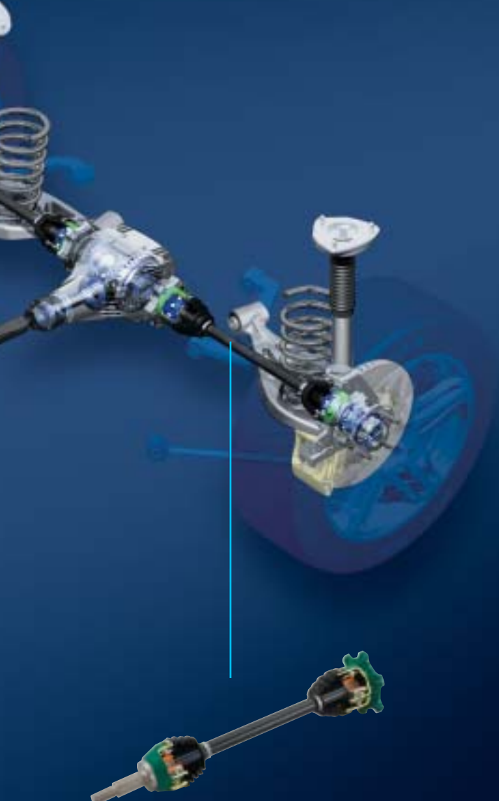
Constant Velocity Joints for Halfshaft ハーフシャフト用等速ジョイント (リア)