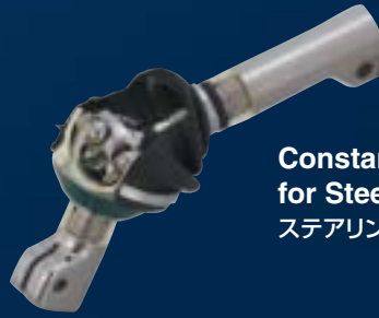
Constant Velocity Joints for Steering ステアリング用等速ジョイント